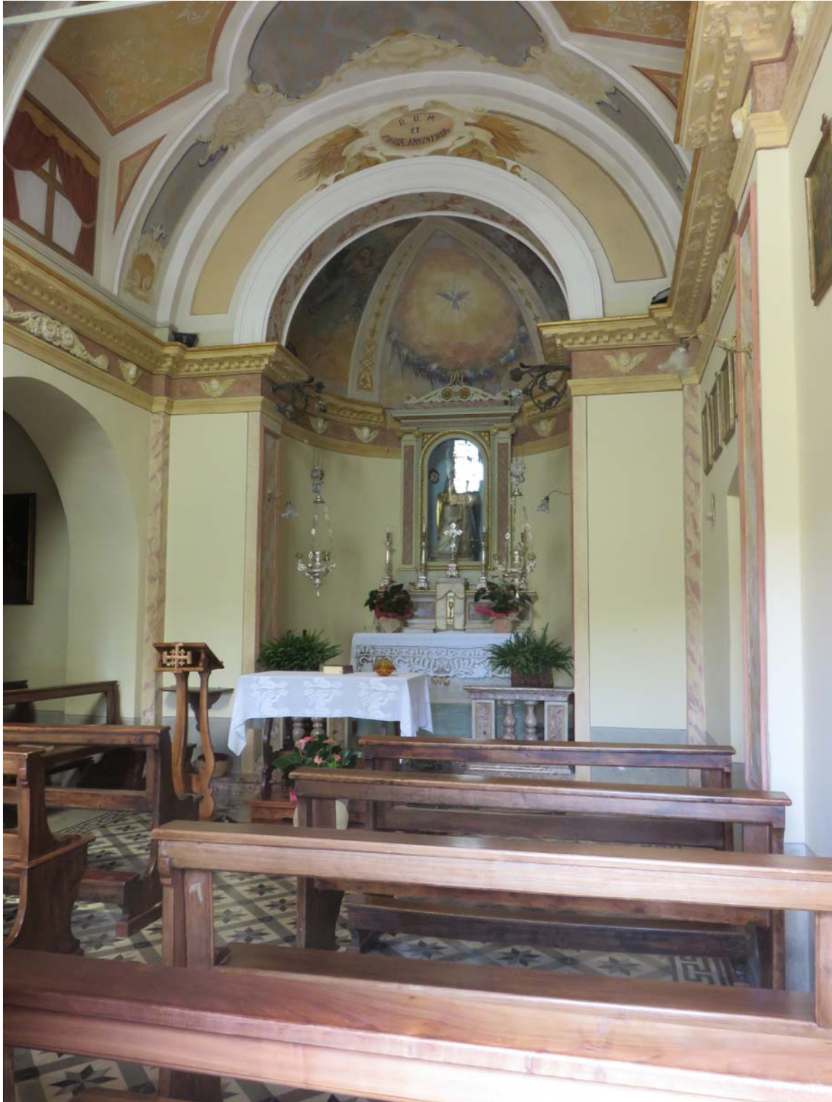
Une petite église avec néanmoins un intérieur digne de plus grandes. Le baroque a aussi passé par là.