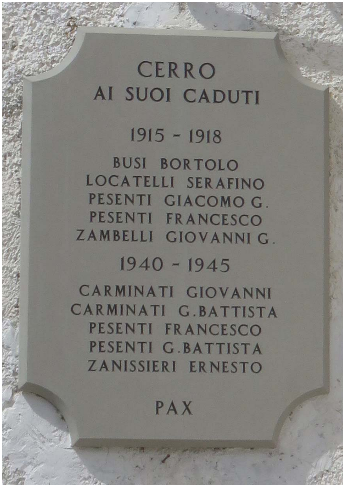
Petit pays. Et pourtant il a fallu aller se battre et mourir en des lointains improbables.