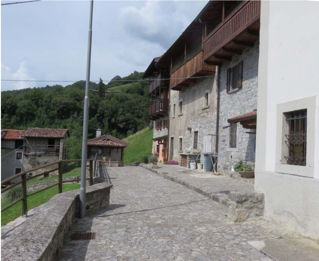
Cerro Sopra. On a respecté les balcons de bois.