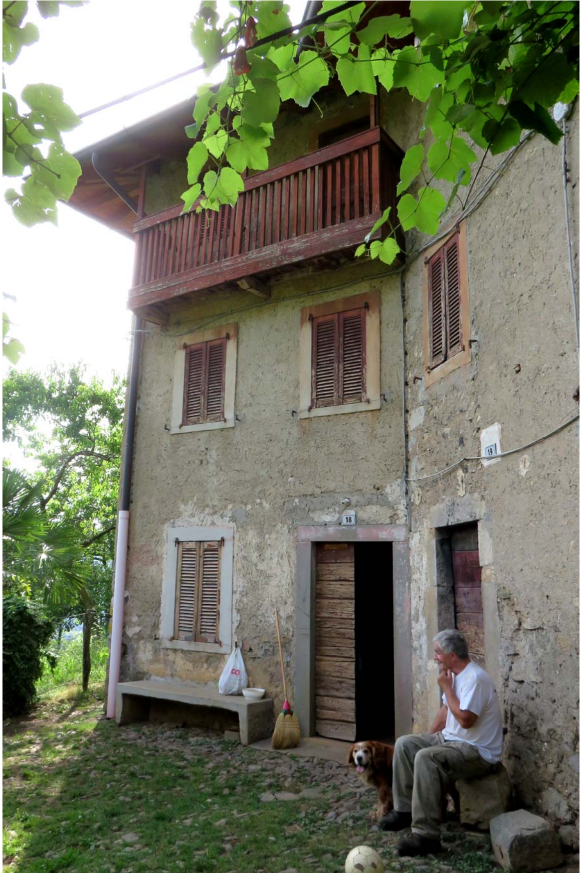
Pradelli, avec l'un des rares habitants plus ou moins régulier.